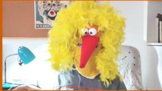
Lady Gagallina Becaria